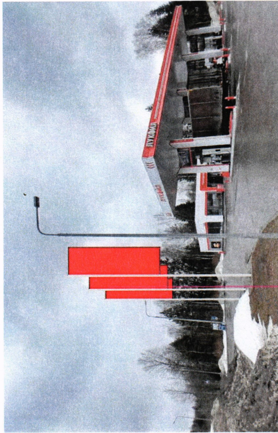
*№ 618 Сторона А (по ходу движения)

Приложение 3 Отдел к постановлению главы Сергиево - Посадского района Московской области от 08.08.2024 № 249-П/Г