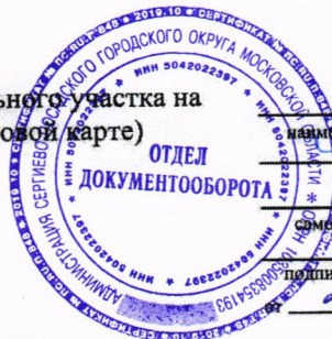
Схема расположения земельного участка на кадастровом плане (кадастровой карте) территории кадастрового квартала N 50:05:0070503

Утверждена постановлением администрации наименование документа об утверждении, включая постановления Сергиево-Посадского городского округа органов государственной власти или органов местного самоуправления, принявших решение об утверждении схемы или подписавших соглашение о перераспределении земельных участков 26.09.2024 № 2493-ПА